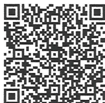
ステンドグラス講座 申し込み QR