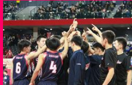
男子バスケットボール部