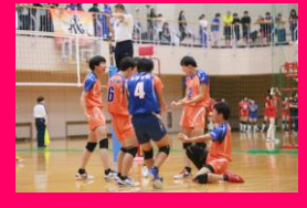
男子バレーボール部