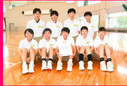
女子バスケットボール部