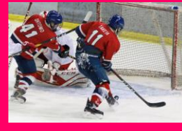
アイスホッケー部