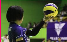
女子バレーボール部