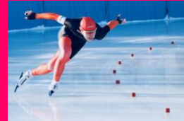
スピードスケート部