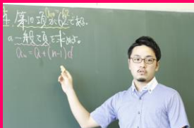
アクティブラーニング 数学